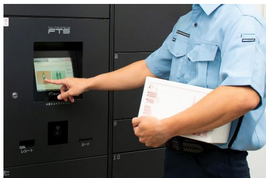
幹事宅配事業者が宅配物を管理

世界に先駆け「宅配ボックス」「宅配ロッカー」を開発、販売する株式会社フルタイムシステム（本社：東京都千代田区 代表：原 幸一郎 以下 フルタイムシステム）の「館内物流対応フルタイムロッカー」が、このたび 2020 年度グッドデザイン賞（主催：公益財団法人日本デザイン振興会）を受賞しました。今回の受賞で当社のグッドデザイン賞の受賞は、3年連続（2012年からでは合計9製品）※となります。