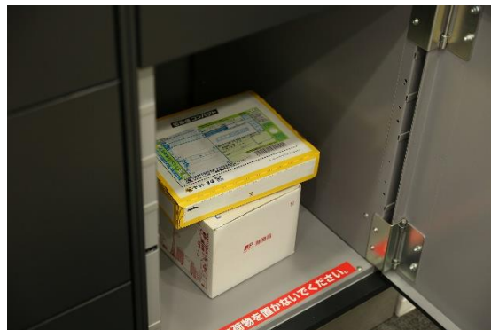
追加の配達物もまとめて一つのボックスに入庫が可能

幹事宅配事業者がフルタイムロッカー（宅配ロッカー、宅配ボックス）のボックス内に荷物を収納し、追加の配達物もボックスにまとめて入庫。一旦入庫した配達物を取り出してまとめて配達することもできるマルチ操作タイプの宅配ロッカー、宅配ボックスです。