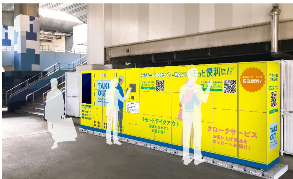
【フルタイムロッカーのイメージ図】