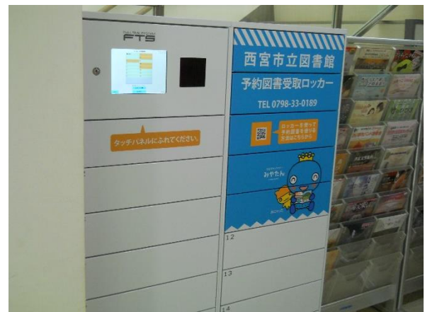
上甲子園センター「予約図書受取ロッカー」