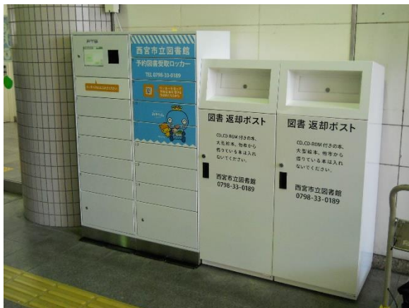
JR 西宮駅前「予約図書受取ロッカー」

当社は、社会環境のニーズを踏まえ、業務の効率化に加え、安心安全な荷物の受け渡しができる環境を提供する手段のひとつとして、「フルタイムロッカー」を市場に展開し、人々が心豊かに暮らせる持続可能な社会への貢献を目指します。