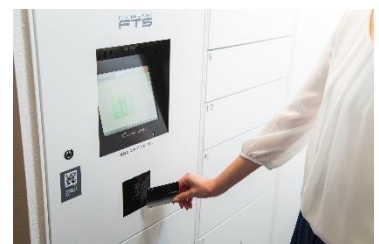
図書館貸出券のバーコードをかざして受取り

フルタイム ボックス ■ 機器ユニット名称：「Fulltime box」 https://www.fts.co.jp/start/public/