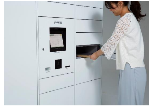
フルタイムロッカー

フルタイムシステムは、世界に先駆け「宅配ボックス」「宅配ロッカー」（フルタイムロッカー）を発明し、集合住宅を中心に戸建て、オフィス、駅などへの設置件数47,000カ所を超える宅配ボックス・宅配ロッカーのリーディングカンパニーです。35年以上にわたりお客様の声に耳を傾け、宅配ボックス・宅配ロッカーと24時間有人対応のコントロールセンターを核とし、レンタサイクル、カーシェアリング、EV充電など、住生活を豊かにする設備やサービスを提供しています。今後も集合住宅のみならず、オフィス、店舗、学校、公共施設など、あらゆるシーンでより快適な生活環境の創出と利便性の向上を目指します。現在では年間で519万人を超える方々にフルタイムロッカーをご利用いただいています。