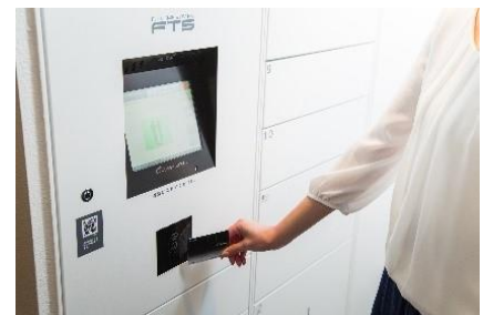
とよかんカードのバーコードをかざして受取り