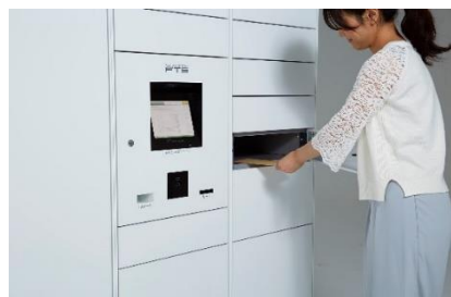
フルタイムロッカー

当社は、世界で初めて宅配ボックス・宅配ロッカーを開発し、「最も長期に亘って営業している電気式宅配ロッカーサービスプロバイダー*2」として、ギネス記録を樹立した企業です。また国連の定める SDGs（持続可能な開発目標）実現のための活動に取り組んでおり、宅配ボックスの整備により荷物の再配達を減らし CO2 削減による地球温暖化防止への功績が認められ環境大臣賞「環境保全功労者表彰」を受賞しております。また創業時から 35 年以上にわたりお客様の声に耳を傾け、宅配ボックス・宅配ロッカーと 24 時間有人対応の