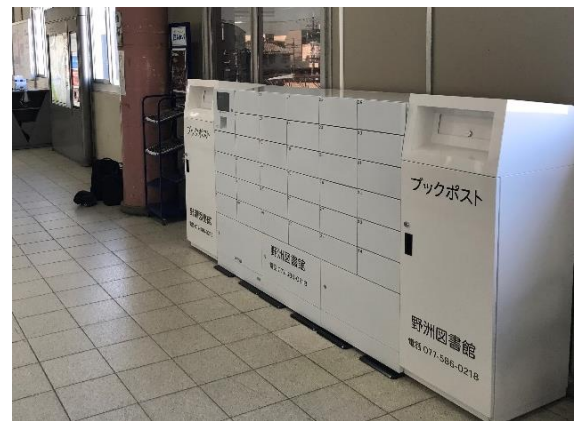
JR 野洲駅自由通路「予約本受取ボックス」「ブックポスト」